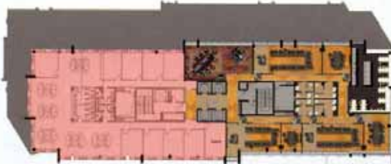
PIANTA SECONDO PIANO