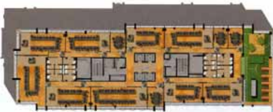
PIANTA PRIMO PIANO